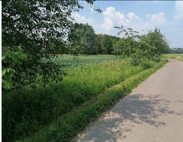
Bild 1) Bereich in an dem neue Bäume gepflanzt werden sollen. Fotografie ausgehend von blauer Markierung in Bild 3 nach „rechts“