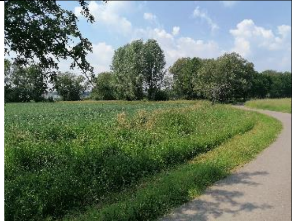
Bild 2) Bereich in an dem neue Bäume gepflanzt werden sollen. Fotografie ausgehend von blauer Markierung in Bild 2 nach „links“